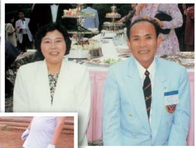
メネットと共に 第48回日本区大会(京都にて)