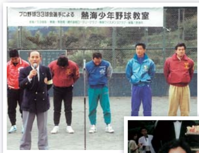
33球会 熱海少年野球教室