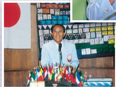
1992年9月例会 会長挨拶